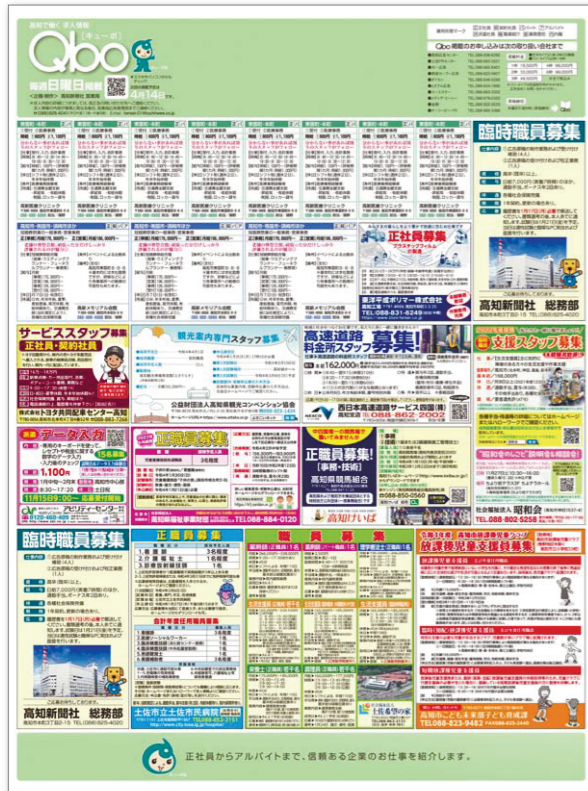
※新聞掲載イメージ