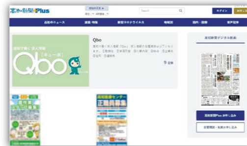
※パソコン閲覧イメージ

【WEBサイトアドレス】 https://www.kochinews.co.jp/series/list/qbo