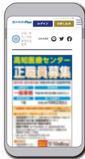
※スマホ閲覧イメージ